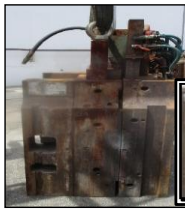
DIE NAME : DCAS08/23A-04 (T16-0440)